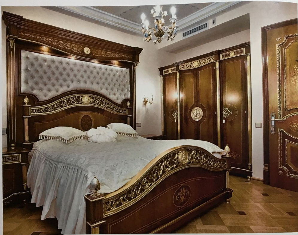
Спальня обставлена мебелью итальянской компании в неоклассическом стиле с богатым золотым декором

Гостиная представляет собой большой светлый зал, объединяющий сразу три зоны: гостиную, столовую и кухню. Их деление обозначено невысокими конструкциями, которые не дробят пространство и смотрятся в интерьере вполне гармонично. Стиль Версаче выдержан здесь во всём: потолок покрыт росписью и украшен пышными люстрами, стены декорированы венецианской штукатуркой нежного сливочного оттенка. Мягкая мебель гостиной привносит в интерьер глубокие благородные ноты: диван и пуфы переливаются золотом, гармонируя с изысканным цветочным рисунком роскошного ковра.